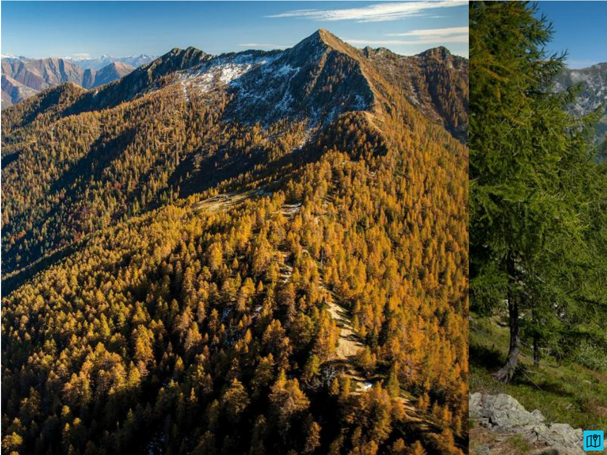
Home (/de/) / Lodano - Soláda - Alp di Pii - Alp da Canaa - Alp da Tramón - Mognèe - Lodano